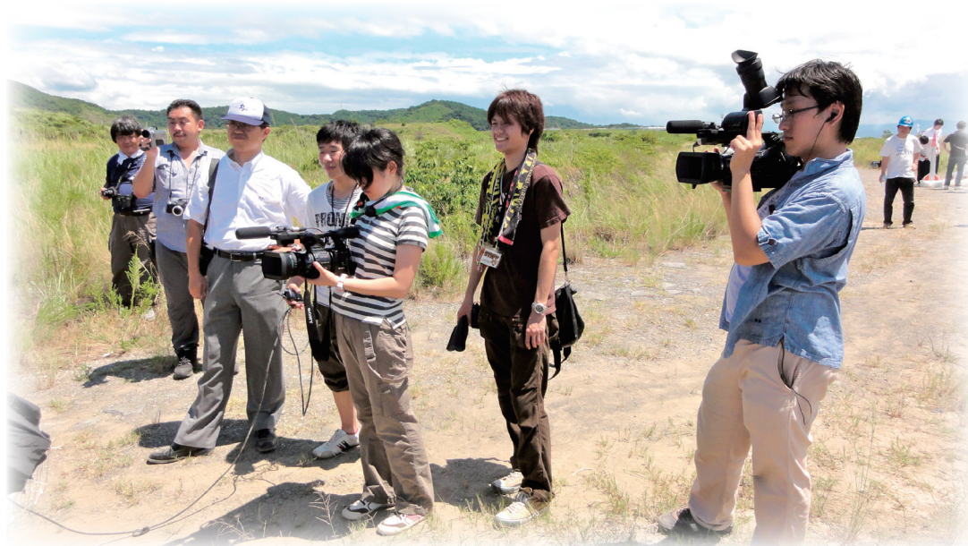
学生自主創造科学センター映像制作プロジェクト