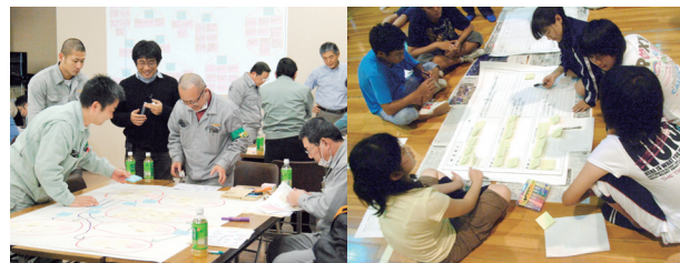
●防災研究教育センター Center for Research and Education of Disaster Reduction

『まかせられる人材育成』をテーマに、宇宙を利用した様々な教育プログラムの開発・実践を行っています。学生が自主・自律的に、宇宙のようなフロンティアへの夢と希望に向かいチームを作りマネジメントを行い、自分達の手で成果を作り出せる人材育成が目的です。当研究所で開発された教育プログラムは学内の全学部で活用され、受講が可能です。また全国の大学・研究開発機関と協力し、日本全体の宇宙教育の中心拠点として、実験場の整備や教育プログラムの開発を行っています。