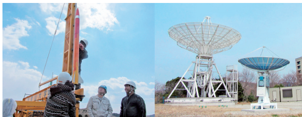
●宇宙教育研究所 Institute for Education on Space

『まかせられる人材育成』をテーマに、宇宙を利用した様々な教育プログラムの開発・実践を行っています。学生が自主・自律的に、宇宙のようなフロンティアへの夢と希望に向かいチームを作りマネジメントを行い、自分達の手で成果を作り出せる人材育成が目的です。当研究所で開発された教育プログラムは学内の全学部で活用され、受講が可能です。また全国の大学・研究開発機関と協力し、日本全体の宇宙教育の中心拠点として、実験場の整備や教育プログラムの開発を行っています。